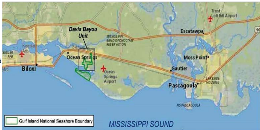
Bản đồ Vicinity Bờ biển Quốc Gia Gulf Islands, Davis Bayou Unit

Việc tắt cả các nhóm người sử dụng sử dụng đồng thời các tuyến đườngkhiến giao thông bị tắc nghẽn và gây khó khăn cho người đi bộ , người đi xe đạp , và xe cơ giới