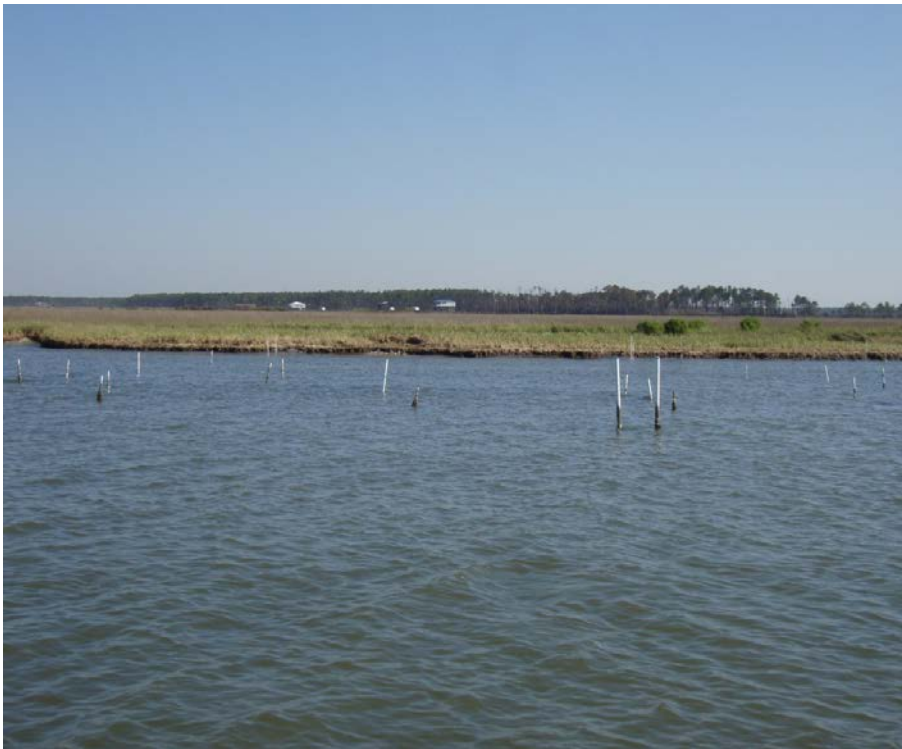
Đường bờ biển bị xói mòn Mississippi Sound.

ĐỂ BIẾT THÊM THÔNG TIN, XIN LIÊN HỆ: Patti Powell Sở Bảo tồn và Tài nguyên Thiên nhiên Alabama (334) 242-3484 patti.powell@dcnr.alabama.gov