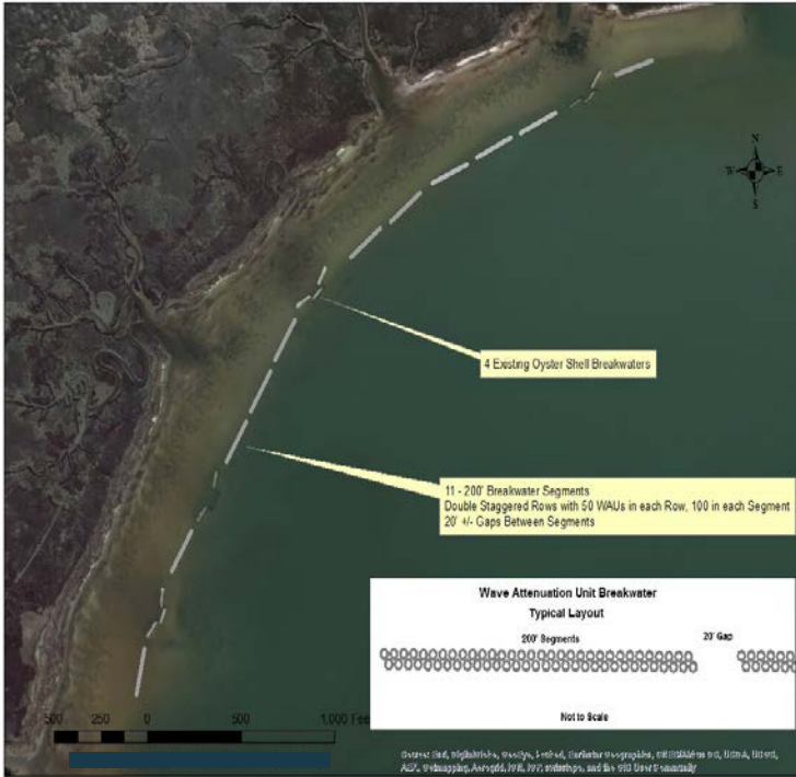
Quy hoạch dự kiến dự án Đường bờ biển sống Point aux Pins.