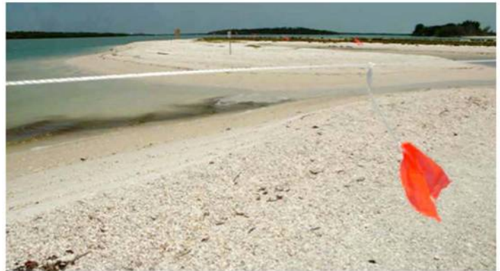
Symbolic fencing protecting beach nesting bird habitat.

Các bãi biển Vịnh cung cấp môi trường làm tổ quan trọng cho các loài chim làm tổ trên bãi biển, trong đó nhiều loài đang nguy cấp. Các dải bờ biển yên tĩnh là các phần quan trọng cần thiết cho các vòng đời của chúng. Sự xáo trộn liên tục do các hoạt động ứng phó với sự cố tràn dầu Deepwater Horizon ảnh hưởng tiêu cực đến môi trường sống cần thiết cho các loài chim làm tổ trên bãi biển. Để bù đắp cho sự xáo trộn gây ra bởi hoạt động ứng phó, mục tiêu của dự án này là giảm các tác nhân gây xáo trộn đến môi trường làm tổ bãi biển đã biết.